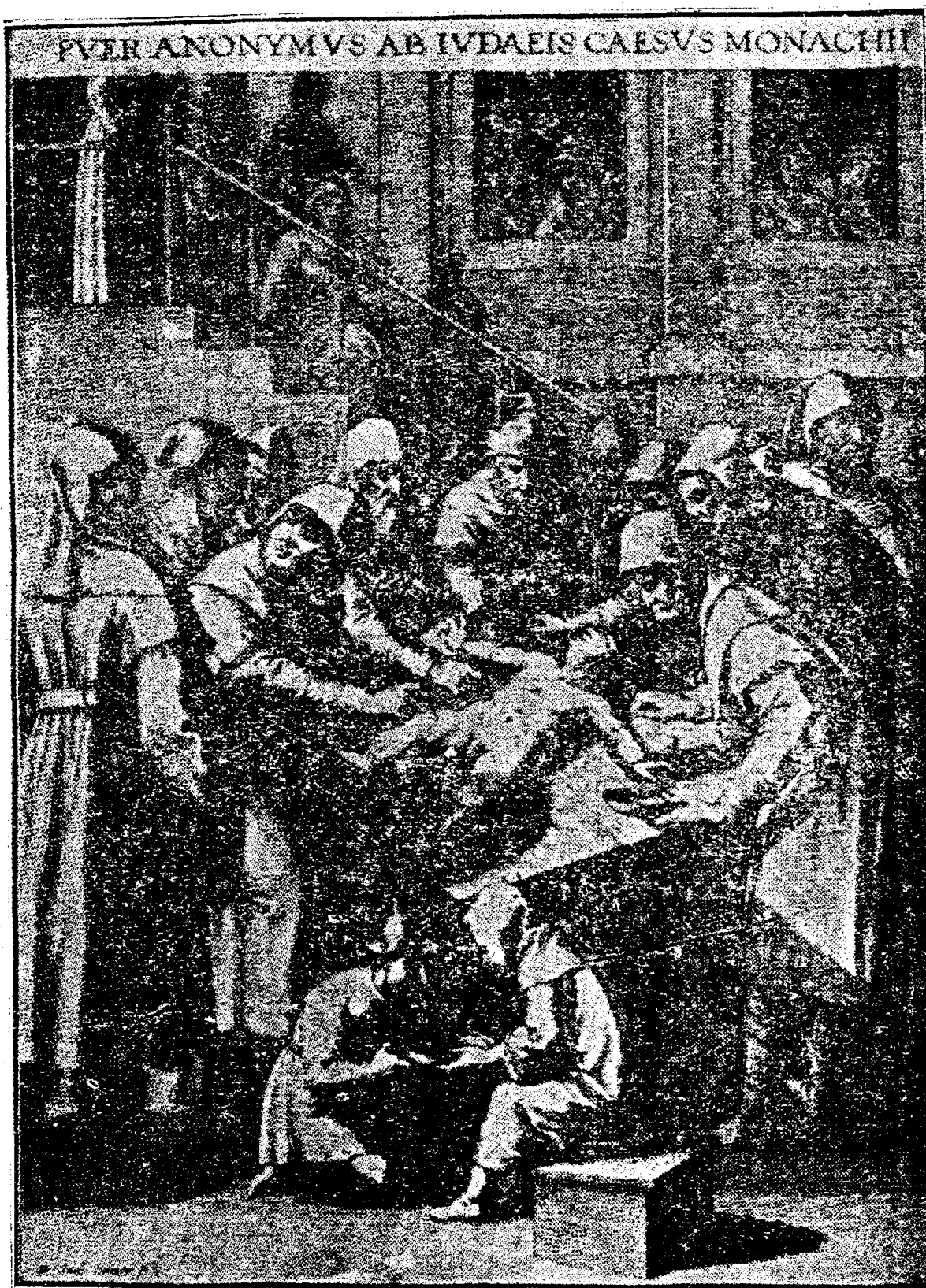
Рисунката е копие от фотографията, намѣрена въ синагогата въ гр. Мюнхенъ по процеса за ритуалното убийство на едно дете.