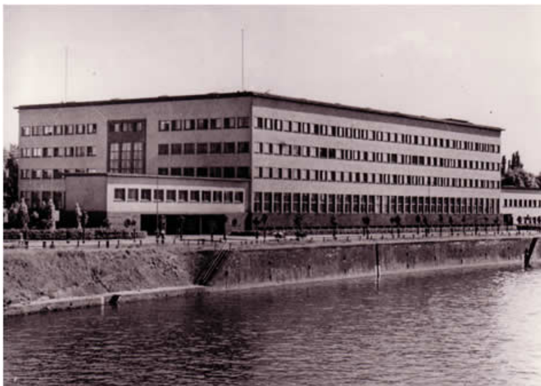
Institut za genetiku i rasnu higijenu u Frankfurtu (1935)