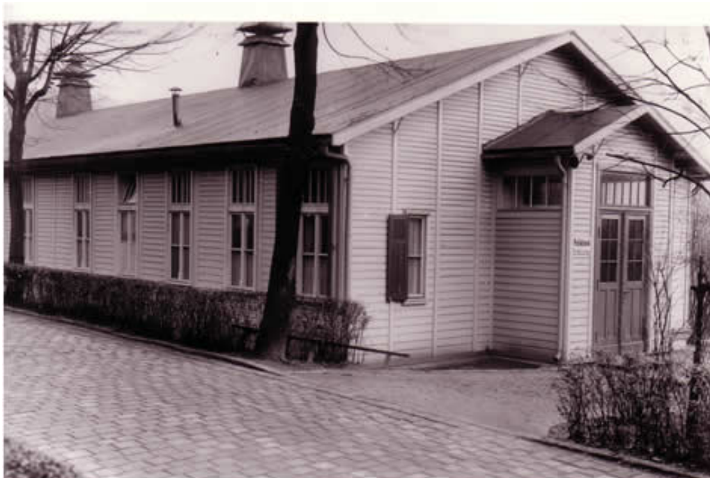
Poliklinika za nasljeđe i rasnu skrb u Berlinu (Dahlem) 1934.