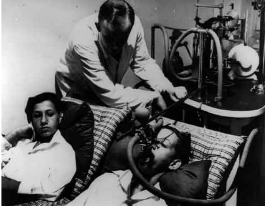
Dr. Otmar von Verschuer tijekom znanstvenog istraživanja blizanaca